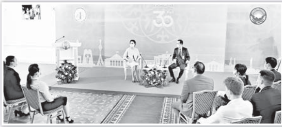
Облыс әкімі Гүлшара Әбдіқалықованың қатысуымен ҚР Тәуелсіздігінің 30 жылдығы аясында 23 маусым – Мемлекеттік қызметші күніне орай жастармен кездесу өтті.

«Баршаныңды Мемлекеттік қызметші күні мерекесімен шын жүректен құттықтаймын! Биыл – Ел тәуелсіздігіне 30 жыл! Егемендік жылдарында дүниеге келген ұрпақ бүгінде мемлекеттік қызметшінің әр саласында табысты еңбек етуде. Ұлт мәртебесін көтеретін, ел абыройын асқататын мемлекеттік қызметші болу – мәртебелі міндет. Мемлекеттік қызметші қызметі кезең де биліктің бейнесін, іскерлік қабілетін көрсетеді. Осы ретте, Сыр елінің өсіп-өркендеуі мен дамуына үлес қосатын өздеріңізсіздер!» – деді Гүлшара Әбдіқалықова.