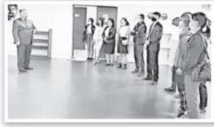
Экскурсия соңында тәрбиеленушілер «Жастар орталығы» аралаған сәтте әсерлерін жарыса айтып, алғыс білдірді.

Экскурсия барысында тәрбиеленушілер орталықтың жұмысымен танысып, мамандармен пікір алмасты.