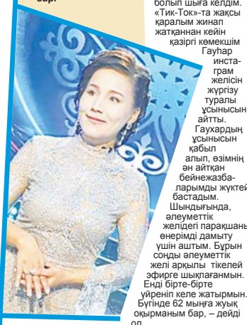
Гүлмайдың үшін соңғы күндер мүмкіндіктер кезеңі болды.