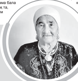
Қасымда кілең жасылар.

ана жалғзынан, бала өскенін айырғалған. Қаралы қағаздар жеткен. Халық бары мен жоғын түгендеп, енді ес жиі бастаған кез ғой. Әке-шешемнің осыған дейін аштық болғанын естип өскен мен соғыстан кейінгі жағдайды да ашықтан көм көрмеймін.