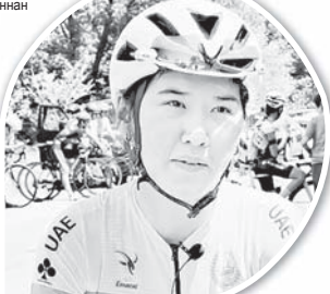
лайықты деңгейде дайындық жасайды. Олимпиадаға қатысу үшін алдымен іріктеу кезеңінен іркімді өтуің керек. Алдағы мақсатымыз – жанкүйерлерді жоғары деңгейімізбен қуанту, – дейді ол.

андыруға болмайды. Жоғары нәтижеге қол жеткізуге барынша күш саласың. Осындай бәсекеңің арқасында әріптестерімен бірге үлкен тәжірибе жинақтайсың. Бізді алда басыңдар деп үміттенеміз. Олардың арасында 2024 жылғы Париж олимпиадасының шоқтығы биік. Мұндай айтулы аламанға әрбір спортшы қатысып, бақ сынауды қалайды. Оған