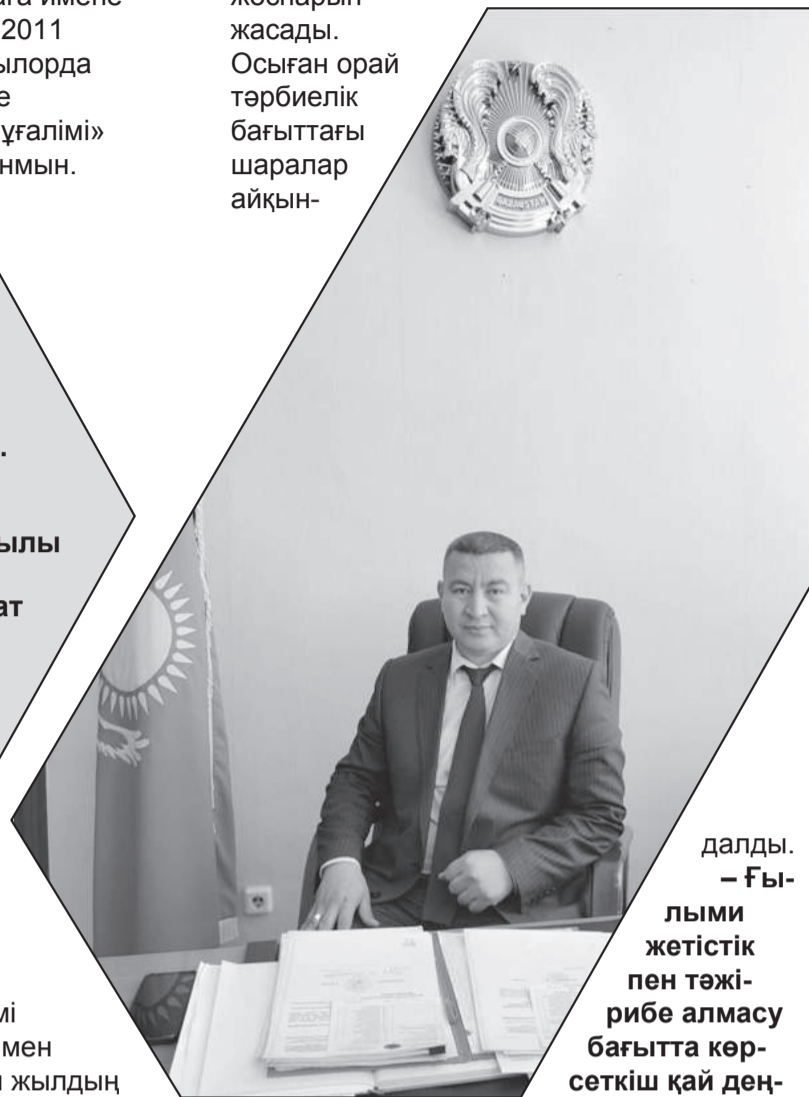
далды. – Ғылыми жетістік пен тәжірибе алмасу бағытта көрсеткіш қай деңгейде?

– Білім беру деңгейі – экономикалық және ғылыми техникалық прогрестің бастау көзі. Сол себепті соңғы жылдары білім саласындағы реформаларды игеру ең оңтайлы шешім болмақ. Бастамашыл мекеме ретінде тәжірибе алмасуды жұмыс жүйесіне енгізу, нақты нәтижеге жету жоспарын құру негізге алынған.