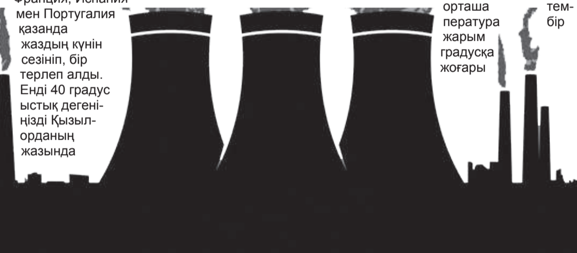
орташа температура жарым градусқа жоғары

адамзаттың өркениетке бастаған жетістіктері болғанмен, табиғатқа жасап жатқан орасан зиянымыз екені анық. Бірақ қазір бүгінмен өмір сүру әлем халқына тән тәрізді.