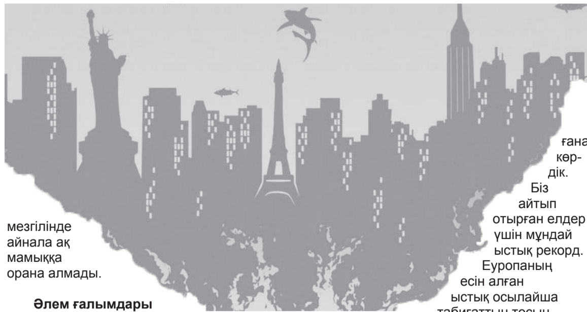
мезгілінде айнала ақ мамыққа орана алмады.

Ел бойынша синоптиктер биылғы қыстың 20 жыл бұрынғы жағдайды қайталайын деп тұрғанын айтады. Бұған Атлант мұхиты аймақтарынан ылғалды ауа массаларының жиі қозғалысы басты себеп дейді мамандар.