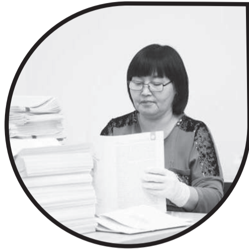
Мыңнан астам баспа тіркелген

– «Адал адам – Адал еңбек – Адал табыс» – бір-бірінен ажырамайтын ұғымдар. Осы үш тағанды озық әрі табысты елге айналудың басты кілті деуге болады. Балалар мен жастарды тәрбиелеп, олардың бойына осы озық құндылықтарды сіңіруге айрықша көңіл бөлінуі керек. Біз, ең алдымен, жастарды кітап оқуға баулуымыз керек. Сонда жаппай кітап оқитын ұлтқа айналамыз. Тәуелсіздік кезеңінде елімізде кітапхана ісі кенжелеп қалды. Тоқсаныншы жылдардағы аласапыран уақытта мыңдаған кітапхана жабылды. Миллиондаған кітап қорынан айырылды. Соңғы жылдары жағдайды түзеу үшін әрекет жасалып жатыр, – деп Ұлттық құрылтайда Мемлекет басшысы Қ.К.Тоқаев атап өтті.