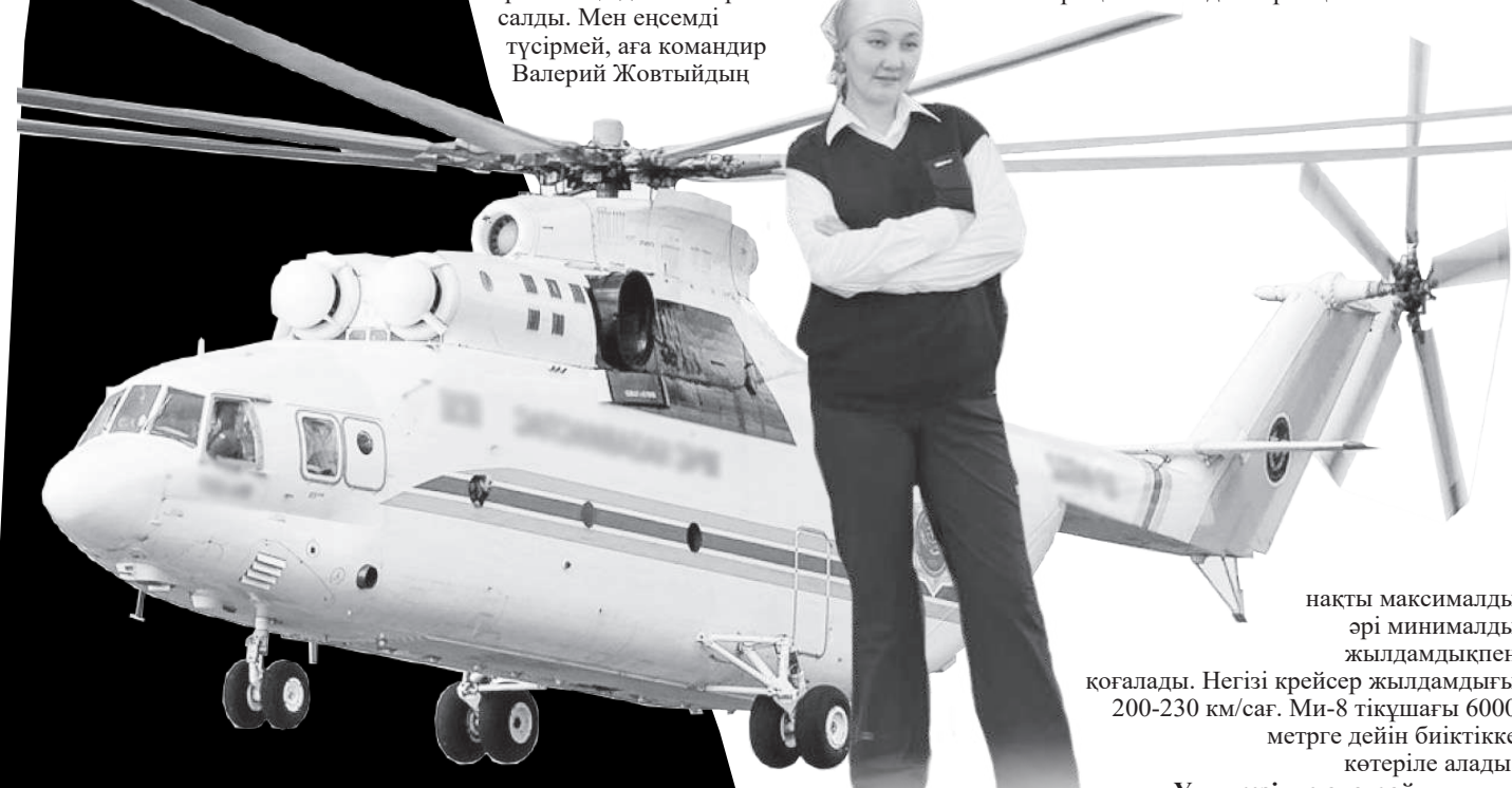
нақты максималды әрі минималды жылдамдықпен қоғалады. Негізі крейсер жылдамдығы 200-230 км/сағ. Ми-8 тікұшағы 6000 метрге дейін биіктікке көтеріле алады.