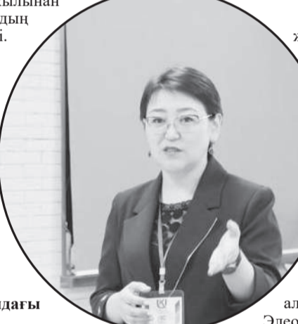
– Фейбуктегі естеліктерде ұстазыңыз Элеонора Сүйейменова туралы жиі айтасыз. Сіз үлгі тұтатын жандар туралы бөлісіңізші.