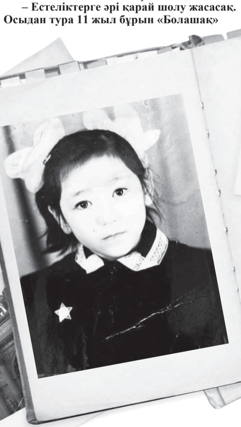
– Өміріңдегі бірінші қолдаушы – әкем мен анам, содан кейін – бауырларым, одан кейін өз отбасым. Әрине, ұстазымның қолдауы ерекше. Неге екенін білмеймін, бірақ әкем мен анам бес баланың ішінде мені ерекше еркелетіп өсірді.