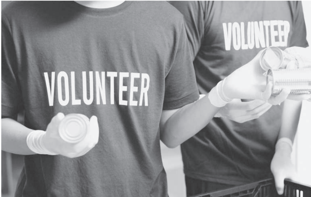
Қос ұғым: асар мен еріктілік

Ал қазан айының басында Астанада жастар кеңесі аясында өткен волонтерлер слетіне Қырғызстан, Ресей, Шри-Ланка, Қытай, Өзбекстан, Әзірбайжан, Иран, Тайланд, Тәжікстан секілді 21 елден 450-ден аса делегат арнайы келді. Екі күндік жиынның маңызы да зор. Себебі негізгі басқосудан бөлек, панельдік сессиялар да ұйымдастырылып, шетелдік спикерлердің қатысуымен «Әлеуметтік және инклюзивті волонтерлік», «Зияткерлік волонтерлік: инновациялық тәсілдер және халықаралық тәжірибе», «Төтенше жағдайлардағы волонтерлік қызмет», «Еріктілердің экологиялық проблемаларды шешуге қосқан үлесі» және «Денсаулық сақтау саласындағы волонтерлердің рөлі» тақырыбы қозғалды.