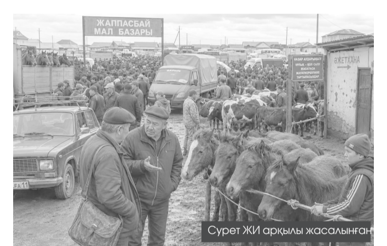
Сурет ЖИ арқылы жасалынған

– Аға, 800 мың теңге. Таза қанды емес, бірақ сол таза қандыңа төтеп береді. Жолда қалдырмайды, – деді.