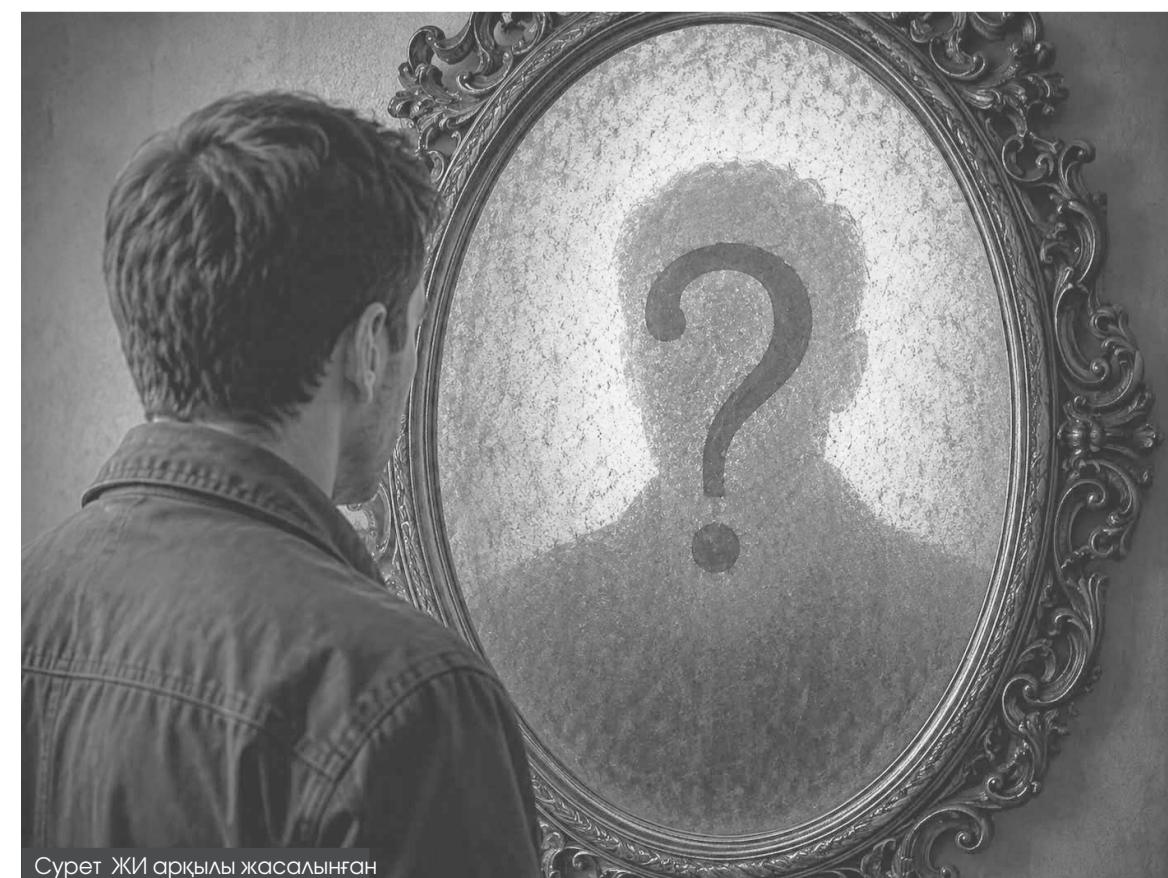
Сурет ЖИ арқылы жасалынған